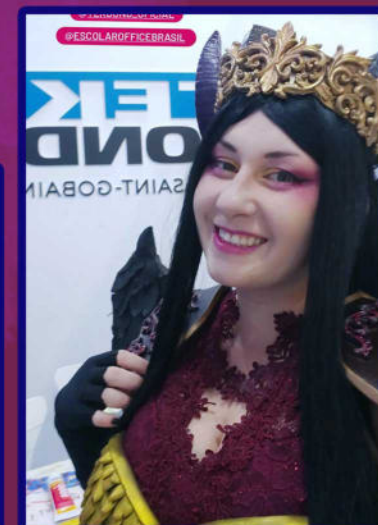
Participei da Escolar Office Brasil com a Tekbond em 2023