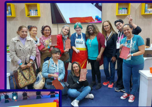
Participei da Renovart e da Mega artesanal com a Tek em 2024 dando aula e como personagem vivo.