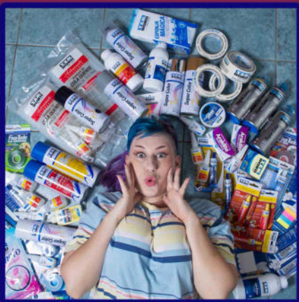
começo de tudo em 2021

Quando a Tekbond criou o projeto TekGeek eu não podia imaginar tudo de bom que viria acontecer... Já tive o prazer de participar de lives da "Jornada do Artesanato", personagem vivo, palestra em eventos, criação de conteúdo para internet e muito mais!!