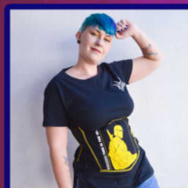
Ação Tekbond + Píticas