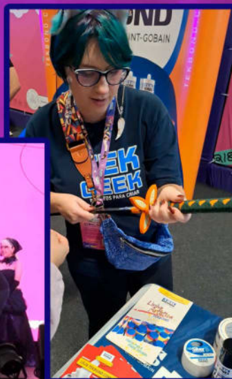
Em 2024 fui junto com tekbond para o Anime Friends fazer o COSHELP e entregar as premiações