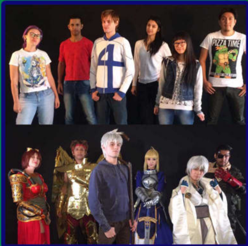
trabalho de personagem vivo para gravação