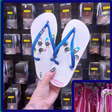
criação para divulgar lançamento de loja

Fazemos também outros trabalhos, desde que possamos usar a criatividade, tudo é possível!!