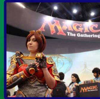
Fiz algumas vezes personagem vivo para Magic the Gathering (empresa Hasbro)