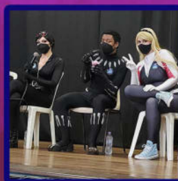
Palestra feita na GeekFest