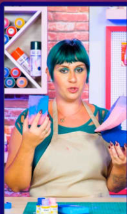
Participei da criação de conteúdo para o lançamento da Linha Artística Tekbond