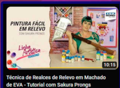
Técnica de Relevo de EVA - Tutorial com Sakura Prongs