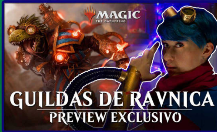
Conteúdos para as redes sociais de Magic the Gathering